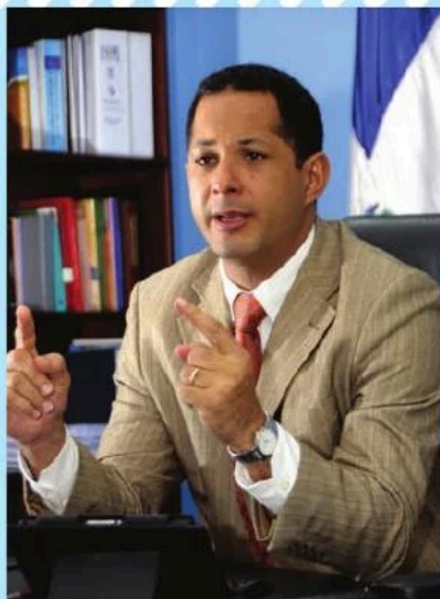
Jorge Félix Minaya, Ministro de la Juventud

La Red Nacional de Acción Juvenil (RNAJ) interpuso hoy dos instancias contentivas de remisiones de acción de amparo ante el Tribunal Superior Administrativo contra Jorge Félix Minaya, en calidad de Ministro de la Juventud, por negar informaciones de carácter público a esa organización juvenil.