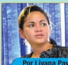
Por Liyana Pavón Lugo

A pesar de que múltiples acuerdos internacionales y la legislación interna reconocen formalmente la igualdad y equidad entre hombres y mujeres, algunos indicadores demuestran lo contrario.