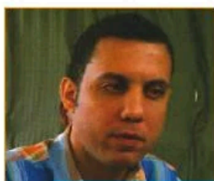
Por José Luis Morillo

Los jóvenes representan el segmento poblacional mayoritario, según los datos de la Oficina Nacional de Estadísticas del censo del año 2010, donde se indica que el 36.4% de la población dominicana, es joven.