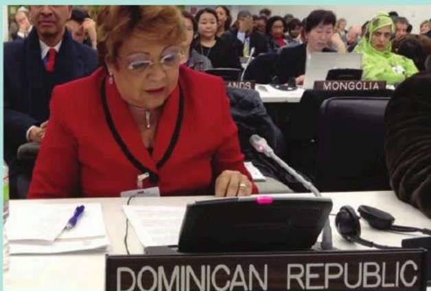
Alejandrina Germán, Ministra de la Mujer durante su intervención en la 57va Sesión de la Comisión para la Condición Jurídica y Social de la Mujer (CSW)

El nivel de participación política de la mujer en República Dominicana se puede medir por los pocos cargos de alta dirección pública que ocupa. También notamos con preocupación la presunción social de que estas funcionarias son las únicas responsables de las políticas de género.