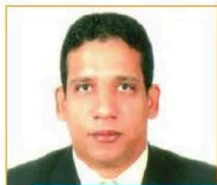
Por Carlos Pimentel F.

El Ministerio de Administración Pública (MAP), implementa un Sistema de Monitoreo de la Administración Pública, (SISMAP), el cual permite dar seguimiento a los diferentes indicadores para evaluar los avances del sector público, en función de los criterios del Barómetro de Servicio Civil.