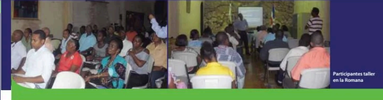
Participantes taller en la Romana