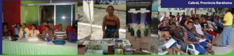
Cabral, Provincia Barahona