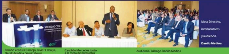
Mesa Directiva, interlocutores y audiencia. Danilo Medina.

En el Marco de los talleres de Análisis en Mesas Provinciales por la transparencia, se realizaron conversatorios sobre Mecanismos de Participación Ciudadana los días 27 de septiembre y 08 de octubre del 2011 en las provincias de La Romana y La Vega, respectivamente. Los mismos se llevaron a cabo con la presencia de representantes de Organizaciones de Sociedad Civil, organizaciones juveniles, mujeres, jóvenes, campesinos y administradores públicos que respaldan las iniciativas en función de una mejor calidad y transparencia de la gestión pública, en las Provincias. Estas organizaciones tienen una arraigada experiencia en procesos de acompañamiento y gestión para la mejora de servicios públicos, en el uso de instrumentos legales para la demanda de información pública, la realización de acciones de masa para reclamar la atención a necesidades que afectan a la población más empobrecida, cabildeo, negociación y participación en la ejecución de iniciativas junto a entidades gubernamentales como lo es en este caso el Consejo Nacional para la Reforma del Estado (CONARE).