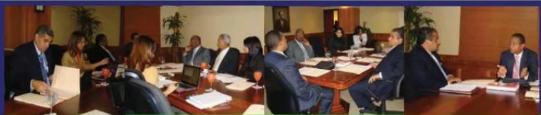
Reunión Ley Orgánica de Administración Pública