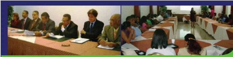
Mesas de expertos de función pública, Provincia de Santiago