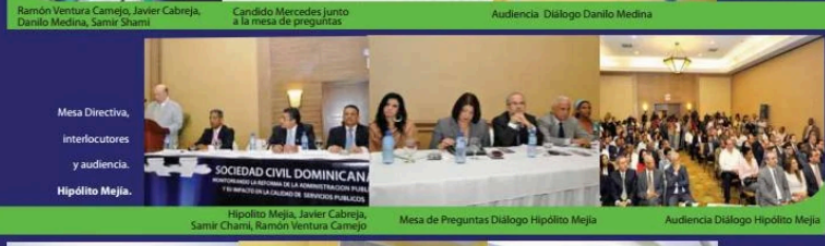
Mesa Directiva, interlocutores y audiencia. Hipólito Mejía.