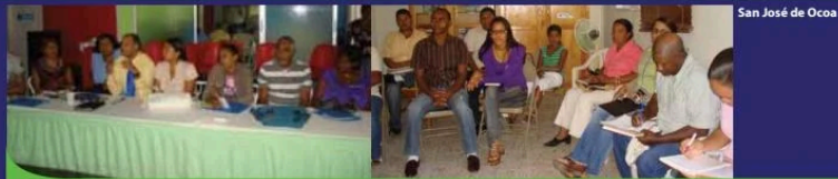
San José de Ocoa