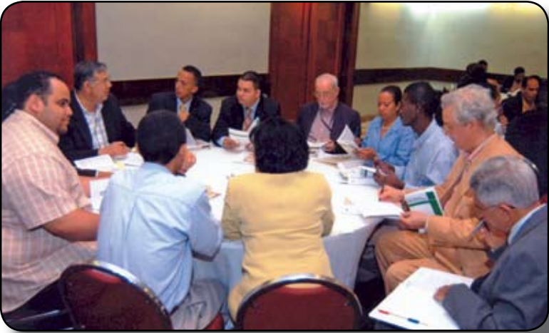
Uno de los grupos de debate conformado durante la actividad.

Agregar párrafo que diga: “ Los programas de formación deberán involucrar a los dirigentes de todos los municipios del país ”.