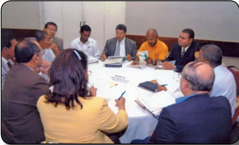
Otro de los grupos de debate.