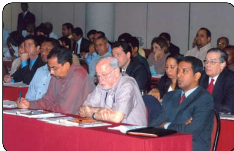
Vista parcial de los asistentes al Seminario-Taller “La Propuesta de Ley de Partidos y Agrupaciones Políticas”.