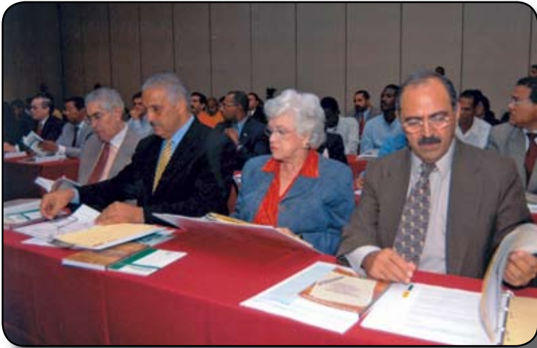
Representante de la Junta Central Electoral y dirigentes políticos de los diferentes partidos asistieron a la actividad.