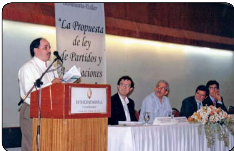
Integrante de uno de los grupos de trabajo mientras expone propuesta de su mesa de trabajo.