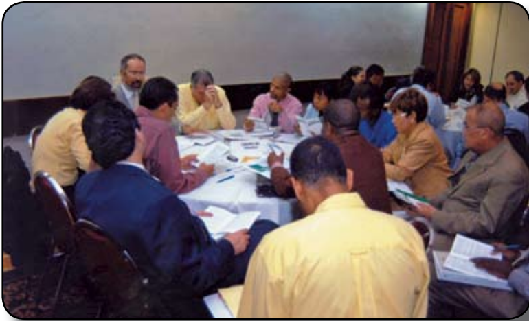
Los integrantes de uno de los grupos analizan uno de los temas de la actividad.

En los artículos 16, 17 y 20 se deberán dividir en dos, uno que regule lo de los órganos directivos y otro para los candidatos.